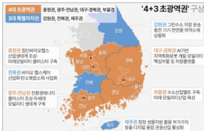
<그림 3> 4+3 초광역권 구상도