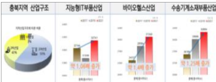
<그림 4> 충북권 산업 성과