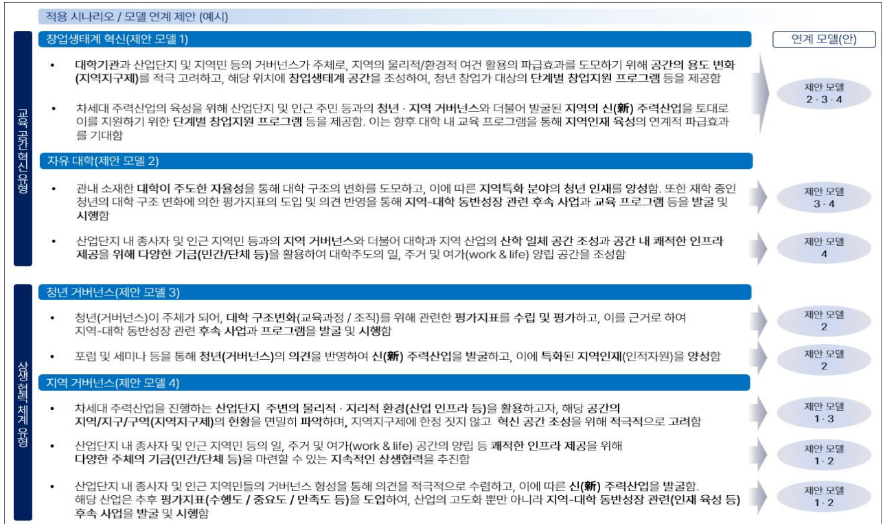
<그림 5> 경산시 지역-대학 동반성장 모델(안)