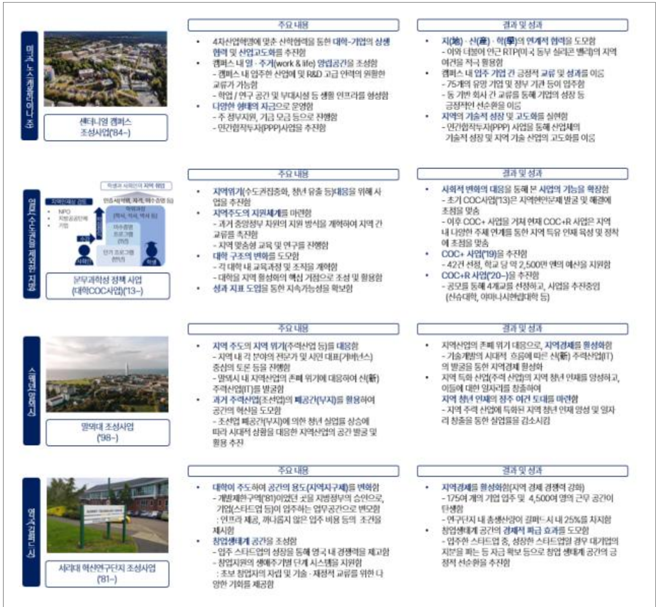
<그림 2> 지역-대학 동반성장 관련 국외 사례